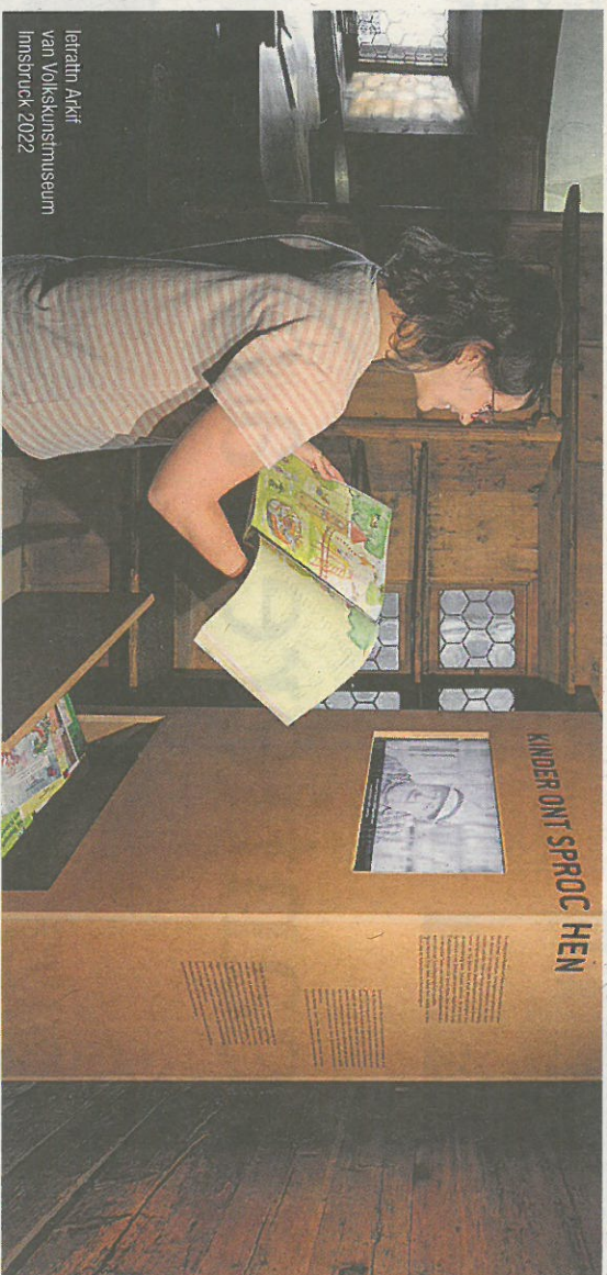
letatim Arkif van Volkskunstmuseum Innsbruck 2022

Asn doi tema, de mearsprocheket ont de inser sproch, ist kemmen organisat an ausstell en Volkskunstmuseum va Innsbruck. Turch materialn, filmen, piacher de pasuacher hom de meglechet za kennen a beane mear de inser gamoaschöft ont de inser sproch. Derball as se sai' noch za schaug s museum, de pasuacher vinnen mearer platz as kontarn va de inser gamoaschöft: an video van koskritim, de gschicht van kruner, kurza interviste en de lait, de spiln en bernstolerisch ont asou envire. S ist an vuim ver za kontarn de inser gamoaschöft, za verstaed ont za vestad se, ver za kennen se,