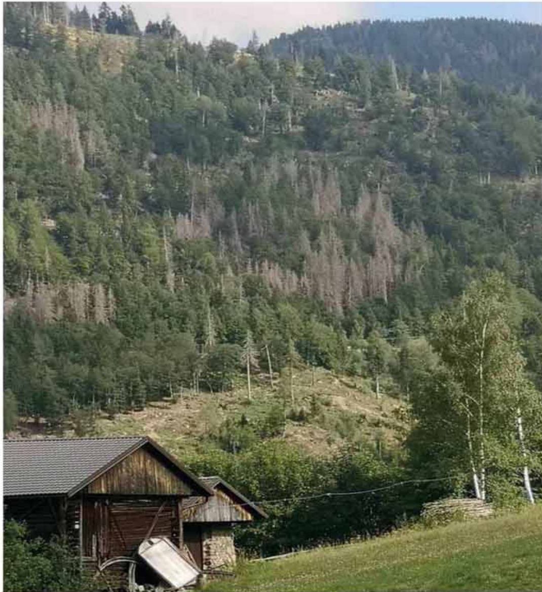
De vaichtn pòckt van bostrico keing Oachpèrg-Palai

De pa'm stèrm ont der bostrico vluttert keing naia tsunta vaichtn