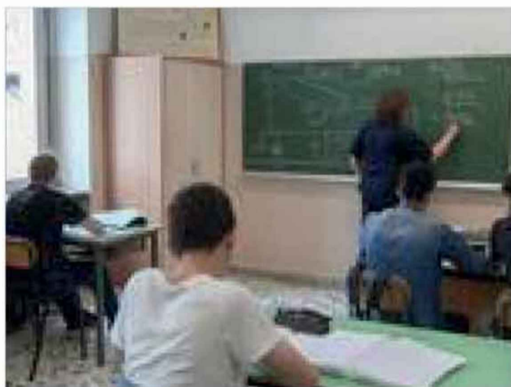
Letratt Druckomt PAT

Vour zboa'sk jor der Tirol ont der Trentin hom u'gaheift an obècksl projekt zbischn de learer van earstn schualn van zboa lander, pet en zil za vongen u' naia zòmmòrbetn aus de grenzn. Der projekt bill nèt lai mòchen kennen de sprochen, ober hèlven s obècksln se van pedagogische, u'lear ont metodologische nochrìcht. S doi ist a schea's ding gaben: va semm hom toalganommen vinfhundert learer. Kan Tiroler Bischoft U'lear Institut ist kemmen gamòcht an zòmmtrèff zbischn draisk learer van Tirol ont van Trentin, ont